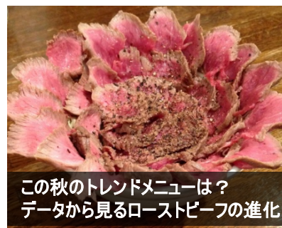
この秋のトレンドメニューは？ データから見るローストビーフの進化