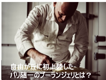
自由が丘に初上陸した パリ随一のブーランジェリとは？