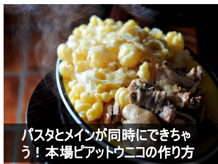
パスタとメインが同時にできちゃう！ 本場ピアットウニコの作り方