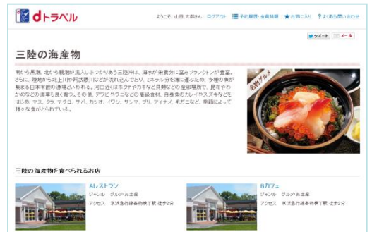
「ぐるたび」提供のご当地グルメページ(PC版)